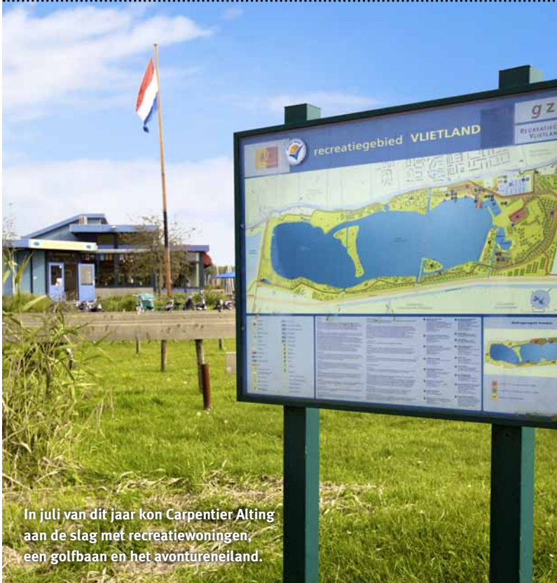
In juli van dit jaar kon Carpentier Alting aan de slag met recreatiewoningen, een golfbaan en het avontureneiland.

ontwikkeling enorm. Zo heb ik helaas ook zelf moeten ervaren. Het is dan ook niet verwonderlijk dat Nederland steeds verder achter raakt bij landen waar veel voortvarender kan worden gewerkt.”